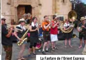
La Fanfare de l'Orient Express