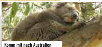
Komm mit nach Australien