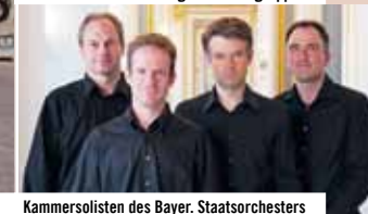
Kammersolisten des Bayer. Staatsorchesters