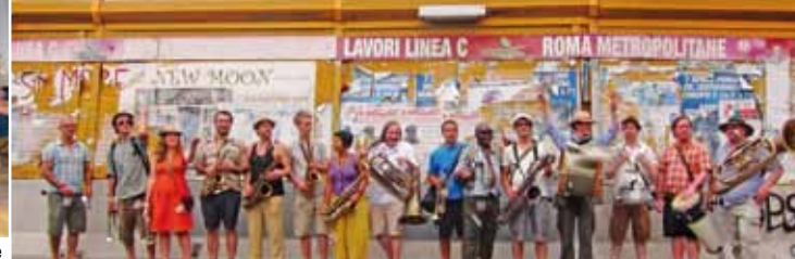
Express Brass Band