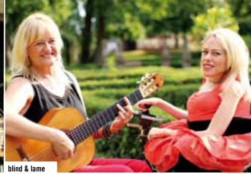
blind & lame